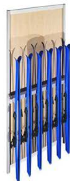
E Porte Skis