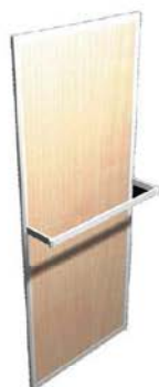
C Portant /ml