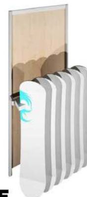
F Porte Snows