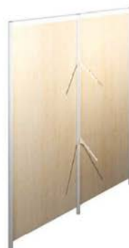
D Portant Perroquet