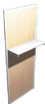
A Étagère Droite /ml