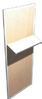
B Étagère Inclinée /ml