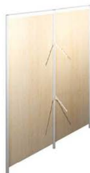
D Portant Perroquet