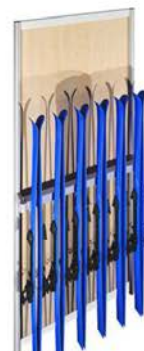
E Porte Skis