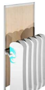
F Porte Snows